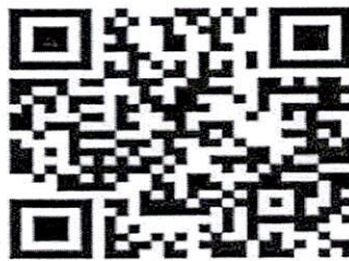
MÃ QR CODE TÀI LIỆU KÈM THEO

(Bộ tài liệu hướng dẫn các quy định về Luật Căn cước năm 2023 và thông tin chi tiết, tài liệu về Cuộc thi tại mã Qrcode)